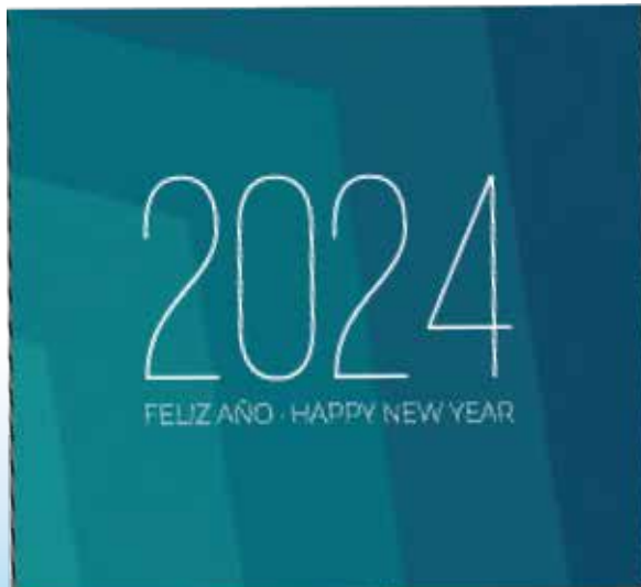
W-80 7 hojas

Para este tipo de calendarios puedes escoger cualquiera de las siguientes 2 referencias o combinarlas entre si: