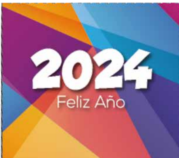
W-81 7 hojas