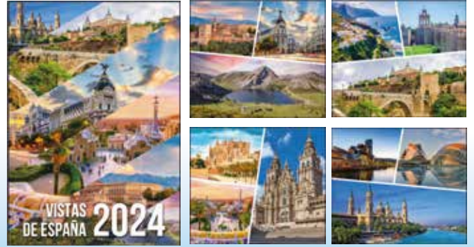
W-726 Paisajes Nacionales