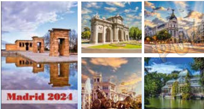
W-234 Paisajes Nacionales