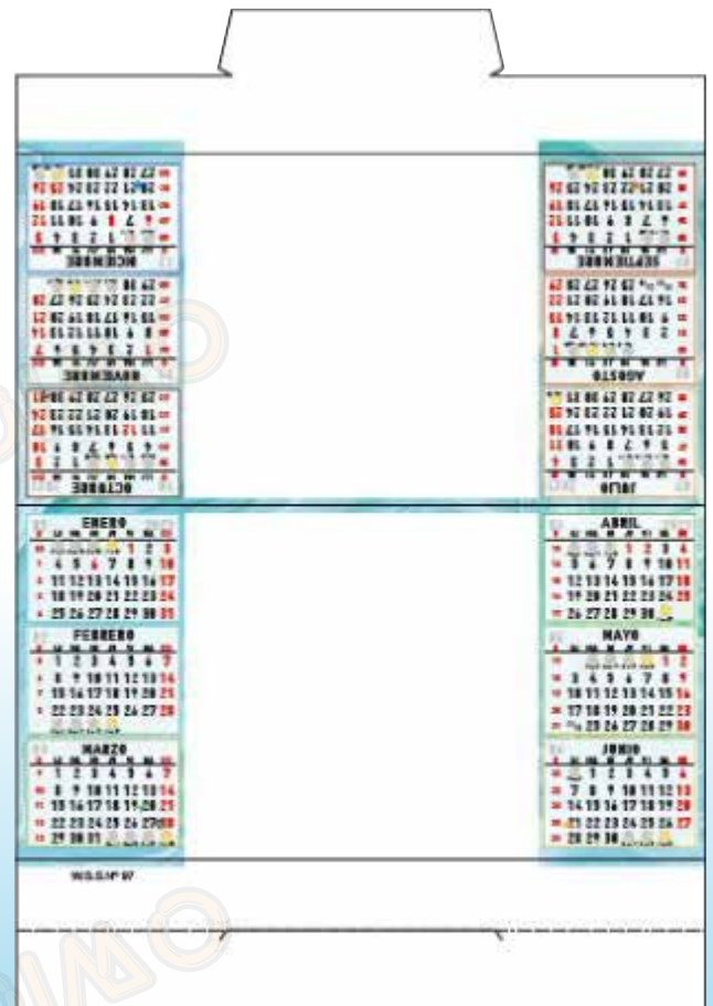
W-102 Sin foto