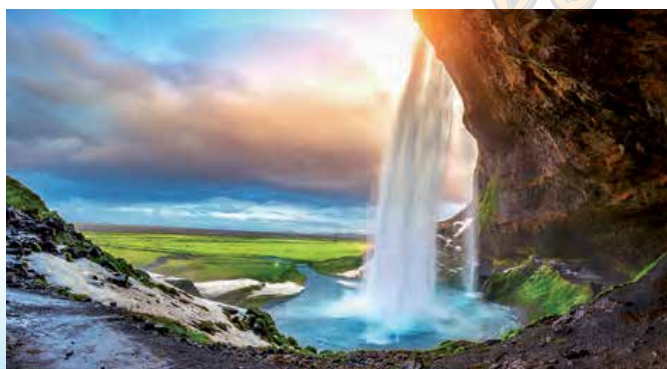
W-91 Paisajes internacionales