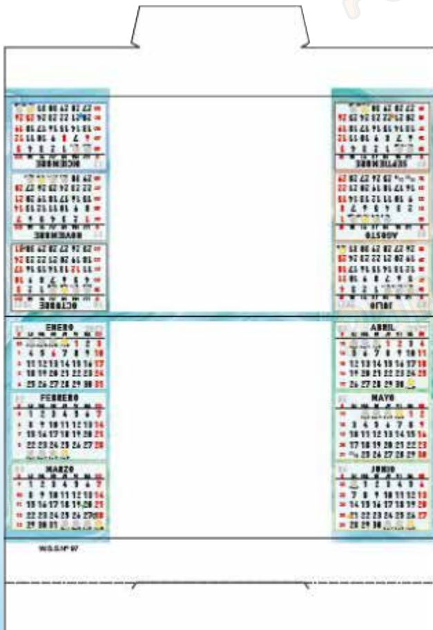
W-97 Sin foto