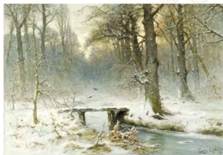
L-3159 Arte Tarde de verano en el bosque L. Apoll