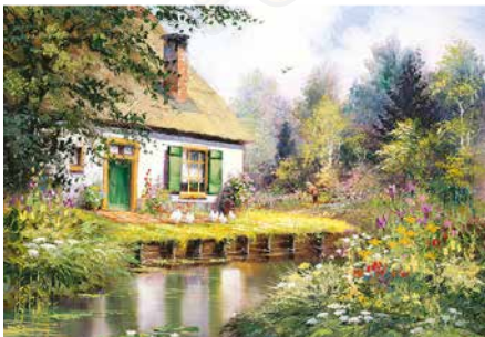
L-3155 Arte Flores salvajes R. Winthaar

RECUERDA! Todas las imágenes se adaptan a la proporción del tipo de calendario que se pida por lo que puede ser que de la imagen que ves en el catálogo se descarten márgenes.