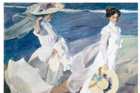
L-3160 Arte Paseo en el mar J. Sorolla

RECUERDA! Todas las imágenes se adaptan a la proporción del tipo de calendario que se pida por lo que puede ser que de la imagen que ves en el catálogo se descarten márgenes.