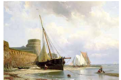
L-3157 Arte El cuartel de Vlissingen J.C. Greive