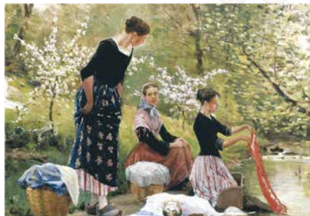
L-3156 Arte Las lavanderas J. Vayreda