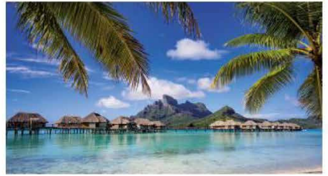
W-91 Paisajes Internacionales