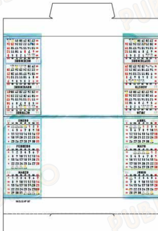
W-102 Neutre català sense foto